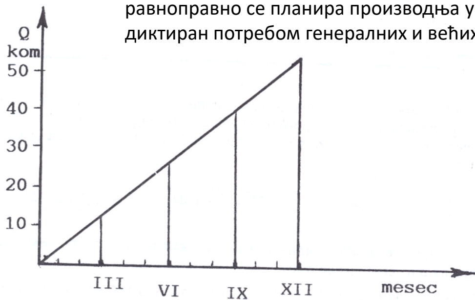
Sl.48. Dinamika proizvodnog programa po mesecima

У случају да предузеће има колективни годишњи одмор у трајању од месец дана, равноправно се планира производња у току 11 месеци. Овакав одмор је најчешће диктиран потребом генералних и већих оправки машина.